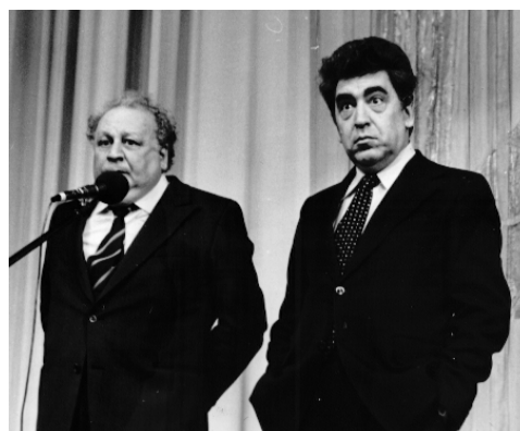
Без шутки жить нельзя на свете