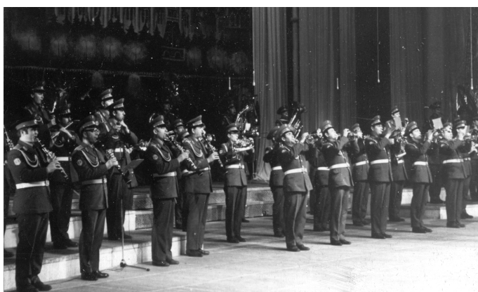
Выступление И. Кобзона в сопровождении оркестра Министерства обороны