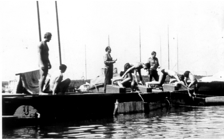
Это вам не закрытый бассейн