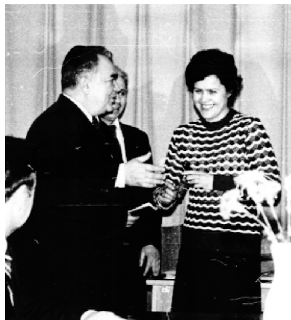
Награждение лучших сотрудников